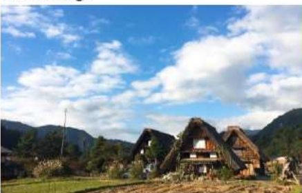
Day 4 Shirakawago