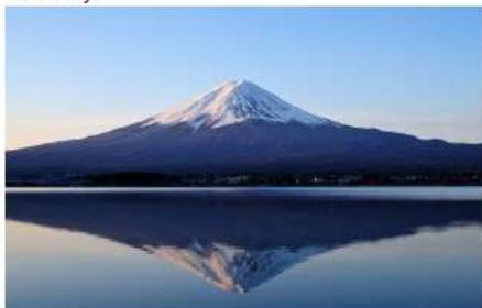
Day 2 Mt.Fuji