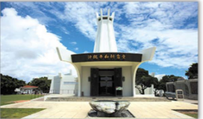
สวนสันติภาพ

สวนสันติภาพ อนุสาวรีย์ที่เป็นสัญลักษณ์ของการสันติภาพ ซึ่งตั้งอยู่ท่ามกลาง สวนสาธารณะ และอุทยาน สวนมีทางล้อมรอบโดยเสาอุปราชที่ออกแบบมาเป็นสัญลักษณ์ ของความสันติภาพ เป็นอนุสรณ์เพื่อรำลึกถึงผู้ที่เสียชีวิตในสมรภูมิที่โอกินาว่าในช่วงสงครามโลกครั้งที่ 2 ซึ่งเป็นหนึ่งในสมรภูมิที่นองเลือดที่สุดในสงคราม