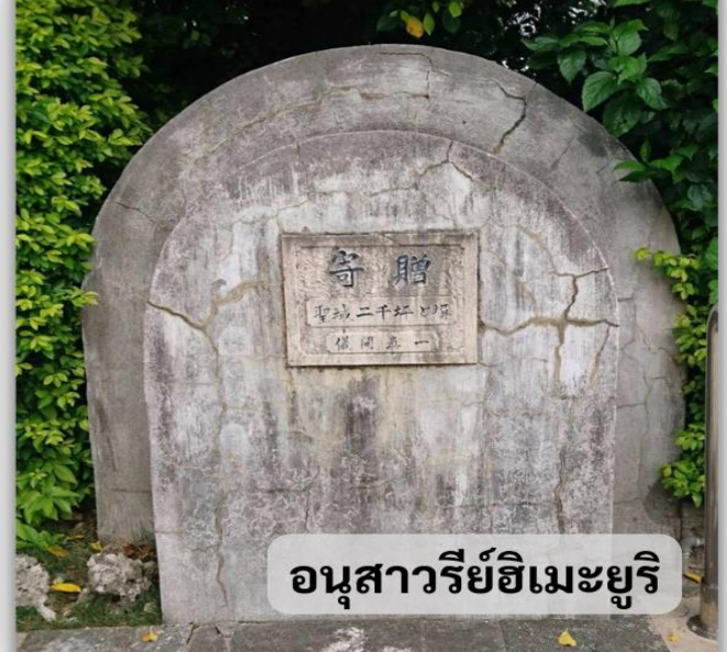
อนุสาวรีย์ฮิเมะยูริ

อนุสาวรีย์ฮิเมะยูริ ที่สร้างขึ้นเพื่อรำลึกถึงดวงวิญญาณของเหล่านักเรียนหญิงฮิเมะยูริที่ได้เสียชีวิตในสงครามโอกินาว่าในปี 1945 และปี 1989 โดยนักเรียนฮิเมะยูริคือนักเรียนหญิงมัธยมปลายและครูที่ได้เข้าไปมีส่วนร่วมในสงครามโอกินาว่าเพื่อดูแลผู้ป่วยขนาน้ำและอาหารให้กับกองทัพก่อนที่จะเสียชีวิตลงจากลูกหลงของการสู้รบที่รุนแรงขึ้น