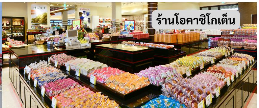
ร้านโอคาชิโกเต็น