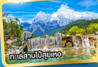
ทะเลสาบไป๋ซู่เหอ