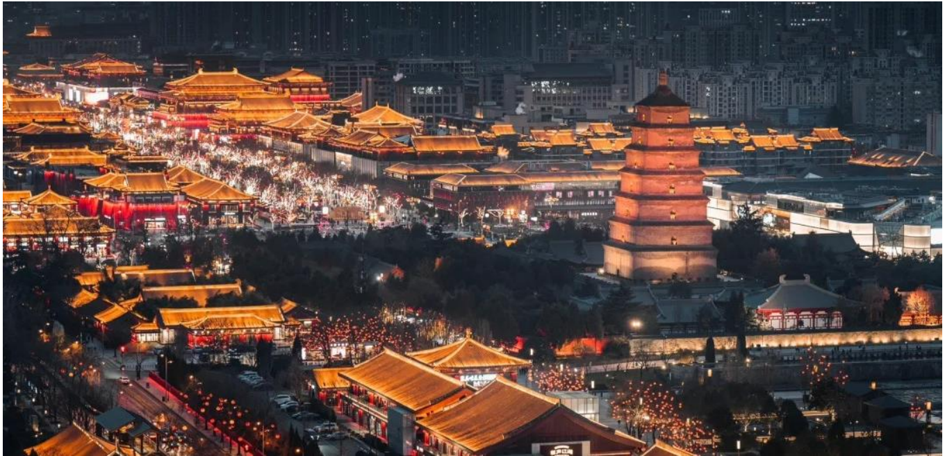
ค่ำ รับประทานอาหารค่ำ ณ ภัตตาคาร (เมื่อที่ 12)

सानซี ตั้งอยู่ในหุบเขาที่มีแม่น้ำเว่ยไหลผ่าน มีประวัติศาสตร์ยาวนานกว่า 3,000 ปี ได้ถูกสถาปนาเป็นราชธานีในนาม “นครฉางอาน” เคยเป็นนครหลวงในสมัยต่างๆ รวมทั้งสิ้น 13 ราชวงศ์ ซื่ออานได้เป็นศูนย์กลางการติดต่อทางเศรษฐกิจและวัฒนธรรมระหว่างจีนกับประเทศต่างๆ ทั่วโลก เป็นจุดเริ่มต้นของเส้นทางสายไหมอันเลื่องชื่อ มีโบราณสถานโบราณวัตถุเก่าแก่อันล้ำค่าและเป็นแหล่งท่องเที่ยวที่สำคัญของจีน นำท่านเข้าชม ถนนคนเดินต้าถิง แหล่งท่องเที่ยวสายไหม เสมือนถนนสายวัฒนธรรม ที่จะประดับสีเหลืองทองยามค่ำคืน ที่ซึ่งเหล่าวัยรุ่นจะมาสวมชุดฮั่นฝูกันเต็มทั้งพื้นที่ตลอดทั้งคืน นอกจากนั้นยังมีร้านค้าเครื่องประดับ ของกินของใช้ และกิจกรรมอีกมากมายให้ท่านได้สัมผัสกันอย่างเต็มอิ่ม