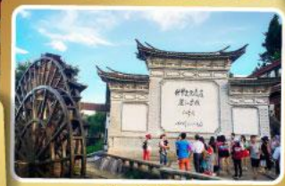
เมืองท่าลี่เจียง