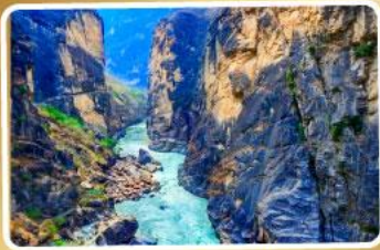
ช่องแคบเสือกะโจน