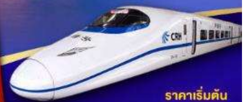
ราคาเริ่มต้น